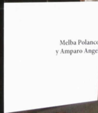
Melba Polanco y Amparo Angel